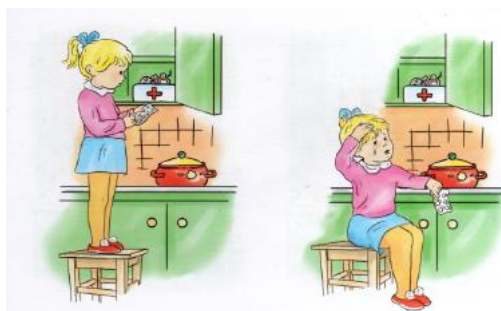
Рис.4 Иллюстрация для задания 3.1