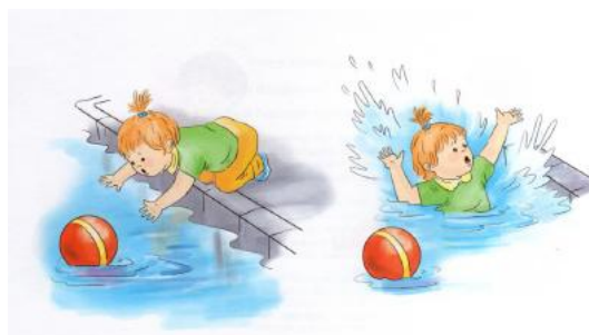
Рис.3 Иллюстрация для задания 2.2