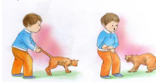
Рис.2.1 Иллюстрация для задания 2.1

Рассмотри картинку. Расскажи, что на ней изображено? (рис..2) Как нужно вести себя с животными на улице? Чего следует опасаться?