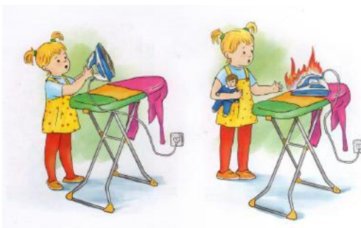
Рис.5 Иллюстрация для задания 3.2

Рассмотри картинку (рис.5). Расскажи, что на ней изображено? Как нужно вести себя с электроприборами?