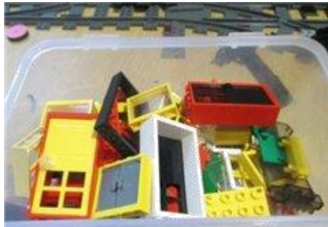
Коробочка со скошенными углами.