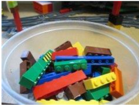
Коробочка с «единичками», «двоячками» и «троячками».