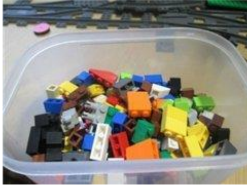
Коробочка с мелкими деталями, начиная от фар и решеток, заканчивая кепками и рюкзаками для человечков.