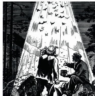
Иллюстрация 6. Рисунок Г. В. Ляхина по произведению П. П. Бажова