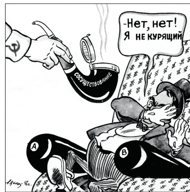
Иллюстрация 5. Карикатура Г. В. Ляхина «Трубка мира»

Геннадий Васильевич ушел из жизни в 1981 г., похоронен на Ширококореченском кладбище. Он был идеалистом, свято верил в будущее коммунистического труда. Он умел изобличать недостатки, мечтал о будущем и был великолепным графическим.