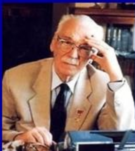
Сергей Владимирович Михалков

Сл. С.Михалкова Муз. А. Александрова Утверждён после выборов Президента в 2000 г.