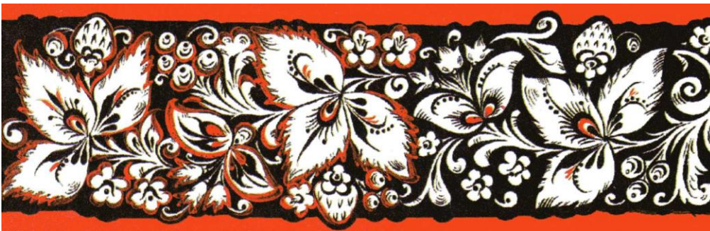
Разновидность фоновой росписи – «кудрина»