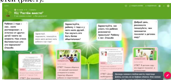
Рис.1 Онлайн-доска Padlet «Растем вместе».

доверия», где родители могут оставить свои вопросы к специалистам центра, ответ далее размещается в папке «Рекомендации». Для дистанционного формата был выбран сервис Padlet – инструмент для совместной работы в виртуальном пространстве, который является бесплатным, имеет русскоязычную версию, прост в освоении и не требует никакой начальной подготовки и имеет возможность организации коллективной деятельности в режиме реального времени, работы с визуальным контентом и размещения материалов с любого носителя и из сети Интернет (фото-, видео-, аудиофайлы). Родителям с помощью объявления в родительской группе WhatsApp, где осуществляется не только оперативное информирование, но и предоставляется возможность родителям обсудить те или иные вопросы, касающиеся жизни группы, не только с педагогами, но также и между собой, было предложено размещать на онлайн-доске Padlet «Растем вместе» свои вопросы, касающиеся воспитания, развития и обучения детей (рис.1).