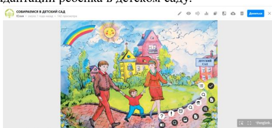
Рис.3. Онлайн-доска Padlet «Собираемся в детский сад»

По результатам данного опроса, для устранения выявленных дефицитов родителей: на странице консультационного центра в Instagram была опубликована серия постов; на платформе TingLing - создан интерактивный плакат «Собираемся в детский сад» с мультимедиа контентом, помогающим родителям сделать процесс адаптации ребенка в детском саду наиболее легким и безболезненным (рис.3). Одним из тегов данного плаката был Google-опросник, созданный на основе методики А. Остроуховой «Определение предполагаемой степени адаптации ребенка к условиям детского сада», после прохождения которого, родители на указанный ими адрес электронной почты получали результаты и краткие рекомендации по успешной адаптации ребенка в детском саду.