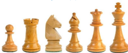
пешка ладья конь слон ферзь король

Всего в шахматной партии участвуют 6 видов фигур - король, ферзь, ладья, конь, слон, пешка. В распоряжении каждого игрока в начале партии 16 фигур: король, ферзь, две ладьи, два слона, два коня, восемь пешек.