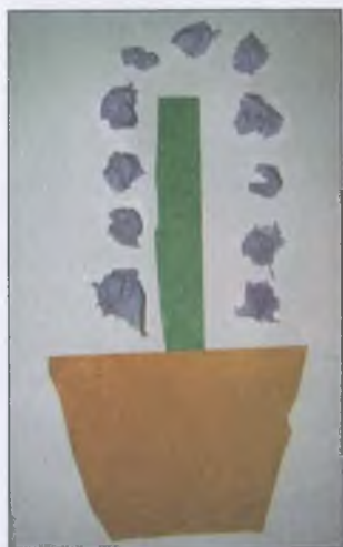
«Цветок в горшке»