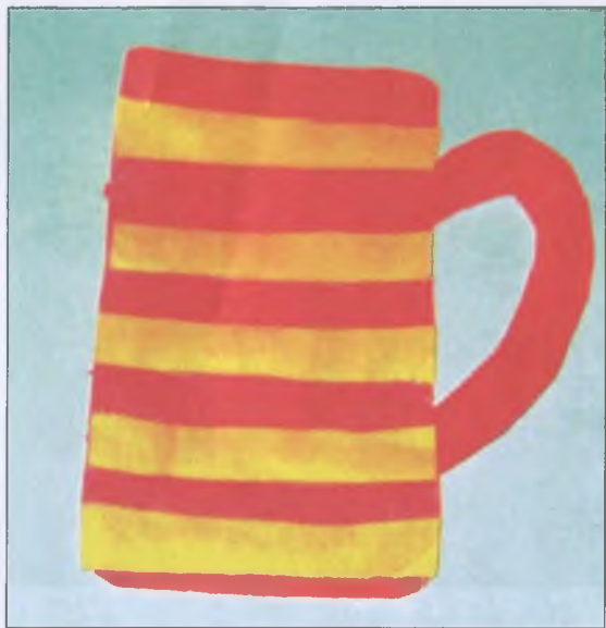
«Полоски на чашке»