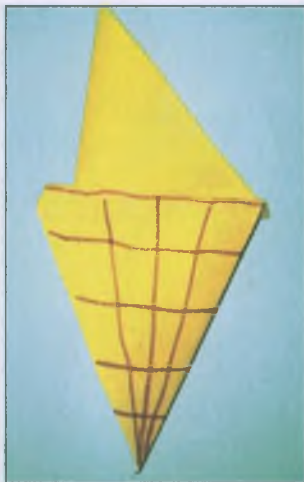
«Мороженое в стаканчике»