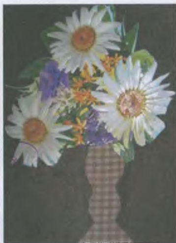
«Цветы в вазе»