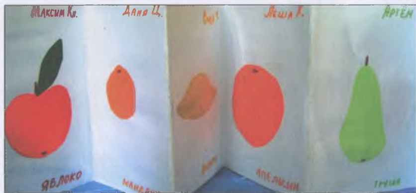
«Ширма с фруктами»